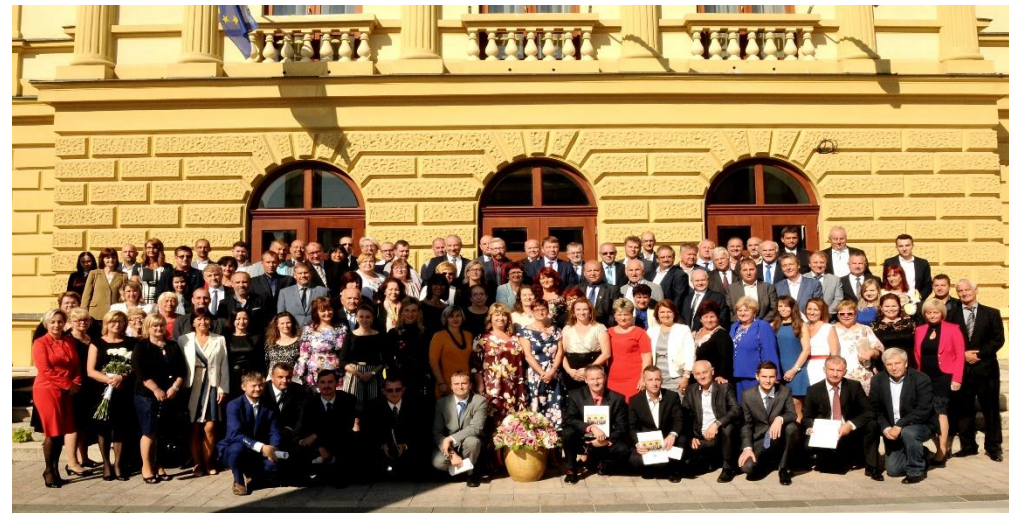
Účastníci slávnostnej konferencie pri príležitosti 25 rokov ZORVC MARTIN 13. september 2019

ZDRUŽENIE OBCÍ REGIONÁLNE VZDELÁVACIE CENTRUM MARTIN Nám. S. H. Vajanského 1, 036 01 Martin E-mail: rvc@rvcmartin.sk Web: www.rvcmartin.sk